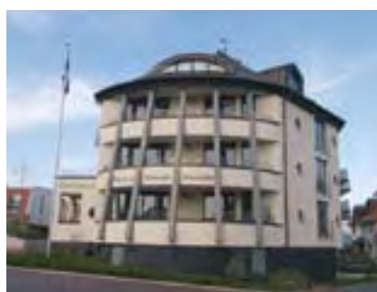
Exklusive Ferienwohnungen: Villa Nordsee