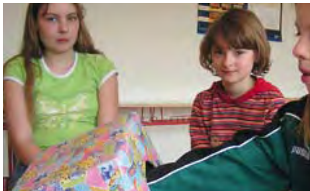
Die Wahrnehmung schulen