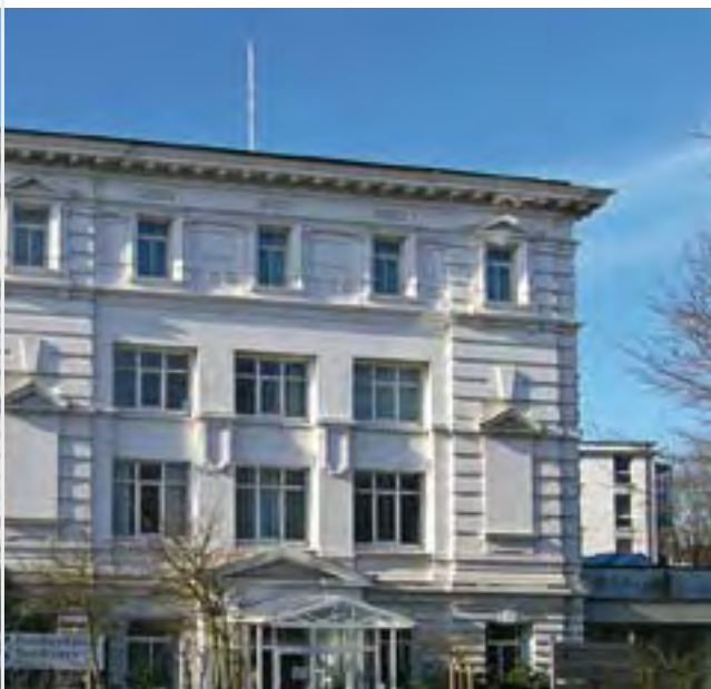
Nordseeklinik Norderney: Hinter der historischen Fassade verbirgt sich eine moderne Rehabilitationsklinik

Ein Schwerpunkt der Behandlung ist neben der krankheitsgerechten medikamentösen Therapie die Neurodermitisschulung : In Kleingruppen werden zunächst die Auslöser und typischen Symptome der Erkrankung besprochen. Medikamentöse Therapieverfahren werden ausführlich erläutert, gegebenenfalls wird deren Anwendung auch demonstriert und eingeübt (z. B. Anwendung von Cremes und Hautschutz) und außerdem werden die Patienten über das richtige Verhalten in kritischen Situationen aufgeklärt. Die geschulten Pflegekräfte unterstützen und motivieren die Rehabilitanden zusätzlich.