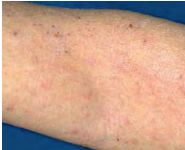
Typisches Ekzem an der Ellenbeuge mit Rötung, Vergrößerung der Haut (Lichenifikation) und Kratzspuren

Gelbliche Krusten und starkes Nässen sind meist Ausdruck einer bakteriellen Superinfektion und sollten zusätzlich mit Antibiotika und kühlenden Umschlägen (zum Beispiel mit kaltem schwarzem Tee) behandelt werden. Zur Vorbeugung von bakteriellen Infekten setzt man eine desinfizierend wirkende