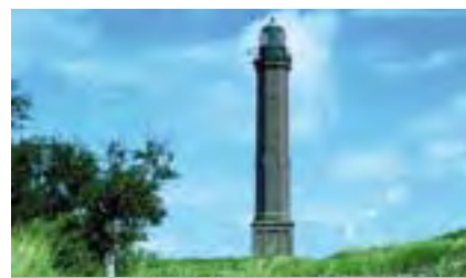
Höchstes Bauwerk: Der Leuchtturm Norderney