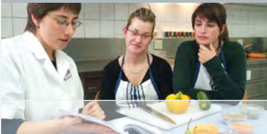
Ernährungsberatung durch die Ökotrophologin: Bei Nahrungsmittelallergien erfolgt eine individuelle Beratung, welche Nahrungsmittel gemieden werden sollten und wie man sich trotzdem gesund ernähren kann

Eine Besonderheit stellt die Klimatherapie dar, bei der durch Kältereize (Bad in der Nordsee) die körpereigene Kortisonproduktion angeregt und die Widerstandskraft erhöht wird.