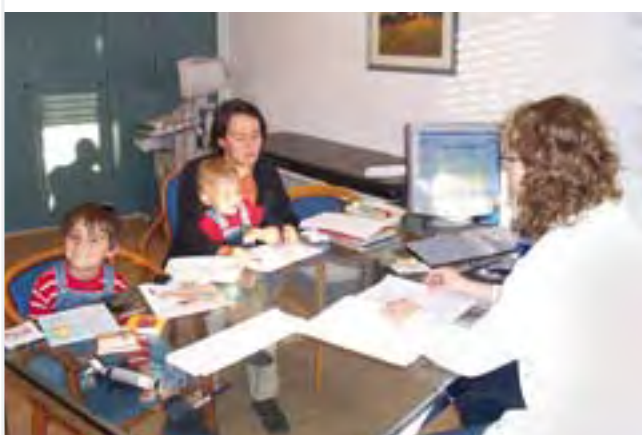
Umfassende Information in der Sprechstunde