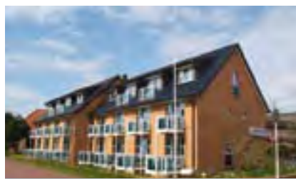
Ferienwohnungen für Familien: Südwesthörn