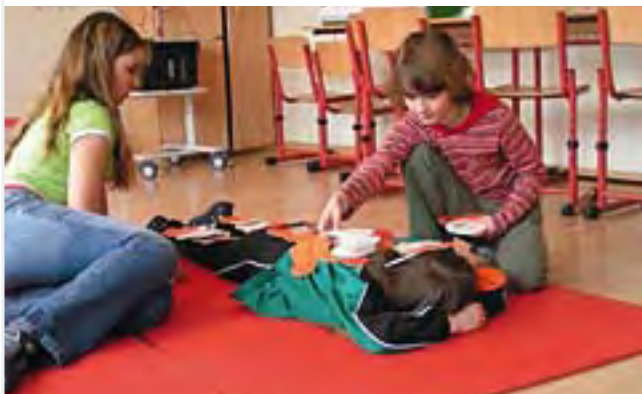
Ausprobieren, was gut tut