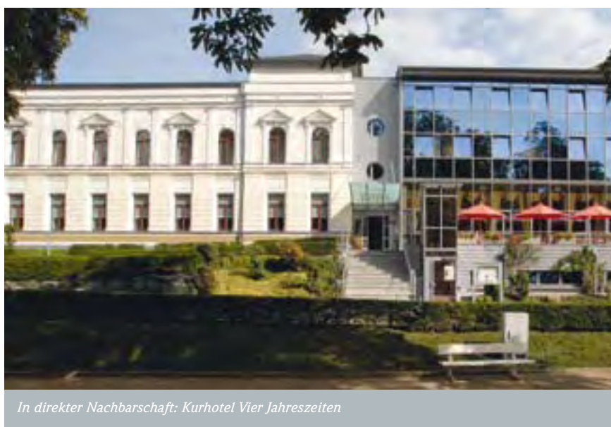
In direkter Nachbarschaft: Kurhotel Vier Jahreszeiten

Ist der Patient im Alltag dann nahezu selbstständig und besteht weiterhin Rehabilitationspotenzial, dessen Ausschöpfung die soziale oder berufliche Teilhabe verbessern würde, so ist eine Rehabilitation der Phase D (Anschlussheilbehandlung) sinnvoll.