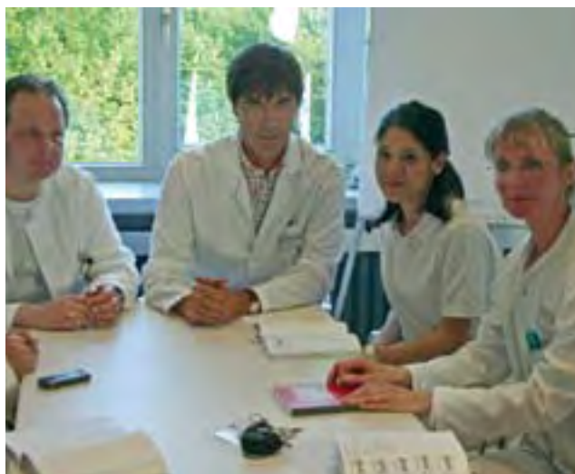
Besprechung im Ärzte- und Therapeutenteam