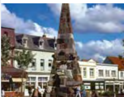
Das Kaiser-Wilhelm Denkmal