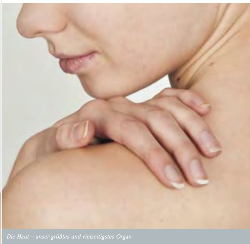
Die Haut – unser größtes und vielseitigstes Organ

Neurodermitis ist eine meist chronisch verlaufende Hauterkrankung, deren Hauptsymptom ein quälender Juckreiz ist. Die Erkrankung beginnt oft schon im Säuglingsalter, im Kleinkindesalter ist sie die häufigste Hauterkrankung: Bis zu 15 % aller Kinder sind betroffen. Bei etwa 50 % tritt im Schulalter eine Besserung ein. Doch auch im Erwachsenenalter kann die Erkrankung zu erheblichen Beeinträchtigungen im Arbeits- und Privatleben führen – zumal meist sichtbare Hautregionen wie Gesicht oder Hände betroffen sind. Eine ambulante Behandlung allein führt häufig nicht zu einer wesentlichen Besserung.