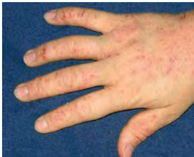
Ein Handekzem schränkt oft schon die Durchführung einfacher Hausarbeiten ein

Triclosan-Creme ein. Nach Abklingen der akuten Beschwerden ist es sinnvoll, moderne Kortisoncremes 1–2 mal wöchentlich vorbeugend anzuwenden, um ein Wiederauftreten der Ekzemerde möglichst zu verhindern. Bei 2 mal wöchentlicher Anwendung sind Kortisoncremes gut verträglich und zeigen keinen Gewöhnungseffekt. Sollte das nicht ausreichen, können auch Protopic-Salbe oder Elidel-Creme als Alternative angewendet werden. Diese wirken bei 2 mal täglicher Anwendung recht gut, die Präparate sind aber sehr teuer und können zu Beginn der Behandlung vorübergehend ein Brennen an der Haut verursachen. Unter Behandlung mit Protopic oder Elidel sollte eine intensive Sonnenbestrahlung oder eine UV-Therapie unterbleiben.