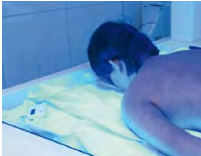
UVA1-Kaltlichttherapie: Bei schwerer Neurodermitis helfen regelmäßige Bestrahlungen, die Haut zu stabilisieren