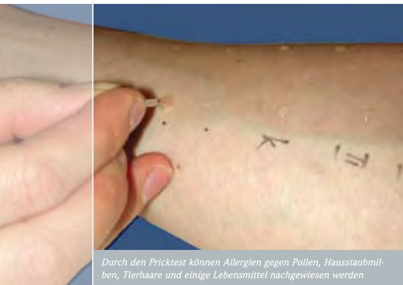
Durch den Pricktest können Allergien gegen Pollen, Hausstaubmilben, Tierhaare und einige Lebensmittel nachgewiesen werden

Zur Juckreizlinderung werden häufig Antihistaminika (zum Beispiel Cetirizin, Loratadin, Telfast) erfolgreich eingesetzt. Allerdings müssen Antihistaminika höher dosiert werden, um eine entsprechende Wirkung zu erzielen. Antihistaminika können aufgrund ihrer zum Teil sedierenden (müde machenden) Wirkung gegen Schlafstörungen eingesetzt werden.