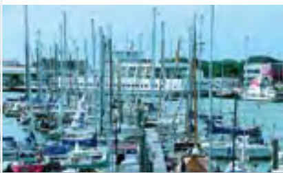
Maritimer Flair: Der Hafen Norderney

Georg V. von Hannover, liegt direkt neben der Nordseeklinik Norderney und verfügt über 19 wunderschöne Gästezimmer. In der Residenz Südwesthörn wohnen Familien in einer modern ausgestatteten kleineren Ferienwohnungsanlage, ruhig gelegen und doch nahe zum Weststrand. Das elegante Ambiente in den acht Wohnungen der Villa Nordsee lässt auch für den anspruchsvollen Norderney-Urlauber keine Wünsche offen.