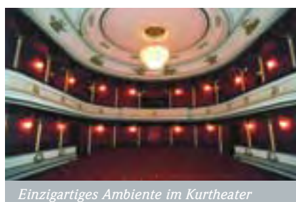
Einzigartiges Ambiente im Kurtheater