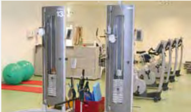
In der Medizinischen Trainingstherapie werden Kraft, Ausdauer und Koordination gestärkt

Hilfestellung wird durch die Teilnahme an der verhaltenstherapeutisch orientierten Raucherentwöhnung angeboten.