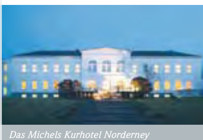
Das Michels Kurhotel Norderney