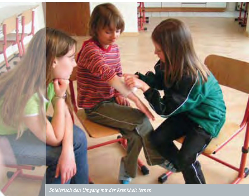
Spielerisch den Umgang mit der Krankheit lernen

10 bis 15 Prozent aller Kinder und Jugendlichen in Deutschland sind an Neurodermitis erkrankt. Diese Hautkrankheit ist bisher nicht heilbar und bedeutet für die jungen Patienten und ihre Familien eine enorme Belastung. Besonders der chronisch wiederkehrende Verlauf mit schwerem Juckreiz und ausgeprägten Schlafstörungen stellt eine große Herausforderung für die Familie dar.