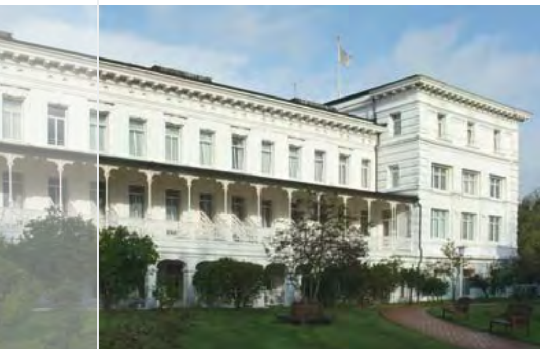
Das ehemalige Kurhotel ist seit 1987 die Nordseeklinik Norderney

In zentraler Lage auf der Insel Norderney, nur wenige Gehminuten vom Weststrand entfernt, bietet die Nordseeklinik Norderney optimale Möglichkeiten für eine erfolgreiche Rehabilitation im heilsamen Nordsee-reizklima. Hinter der historischen Fassade des ehemaligen Kurhotels Norderney wurde 1987 die moderne Rehabilitationsfachklinik für Hautkrankheiten, Atemwegserkrankungen und Allergien eröffnet.